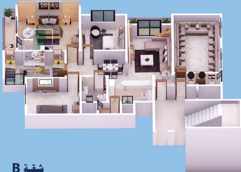
شقة B 230 m 2