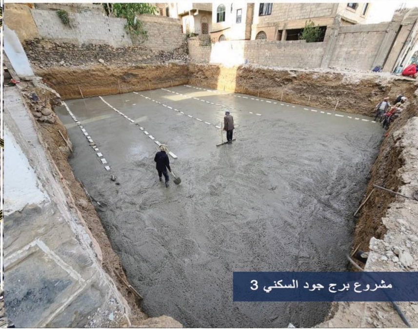
مشروع برج جود السكني 3