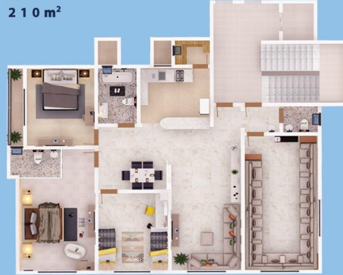
شقة A 210 m 2