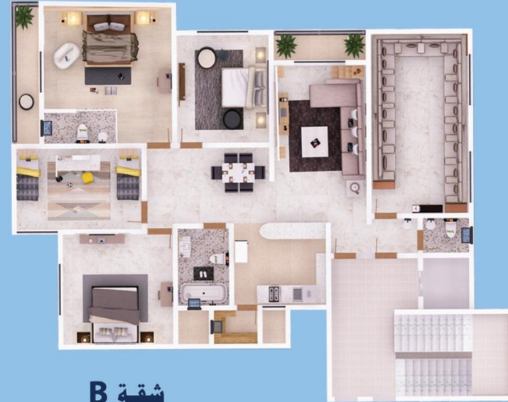
شقة B 230 m 2