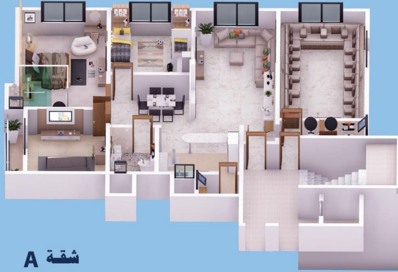
شقة A 210 m 2