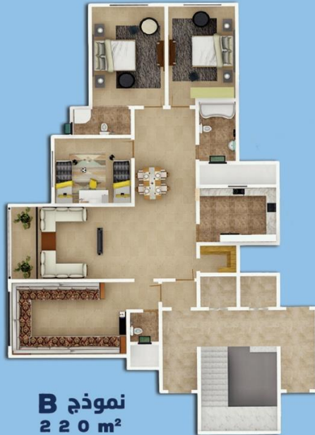
نموذج B 220 m 2