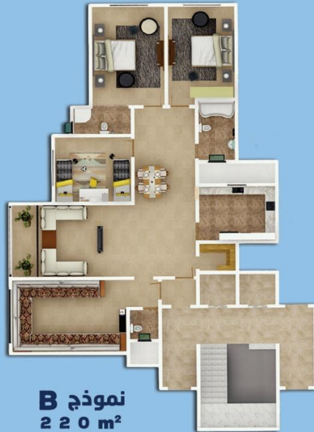
نموذج B 220 m²