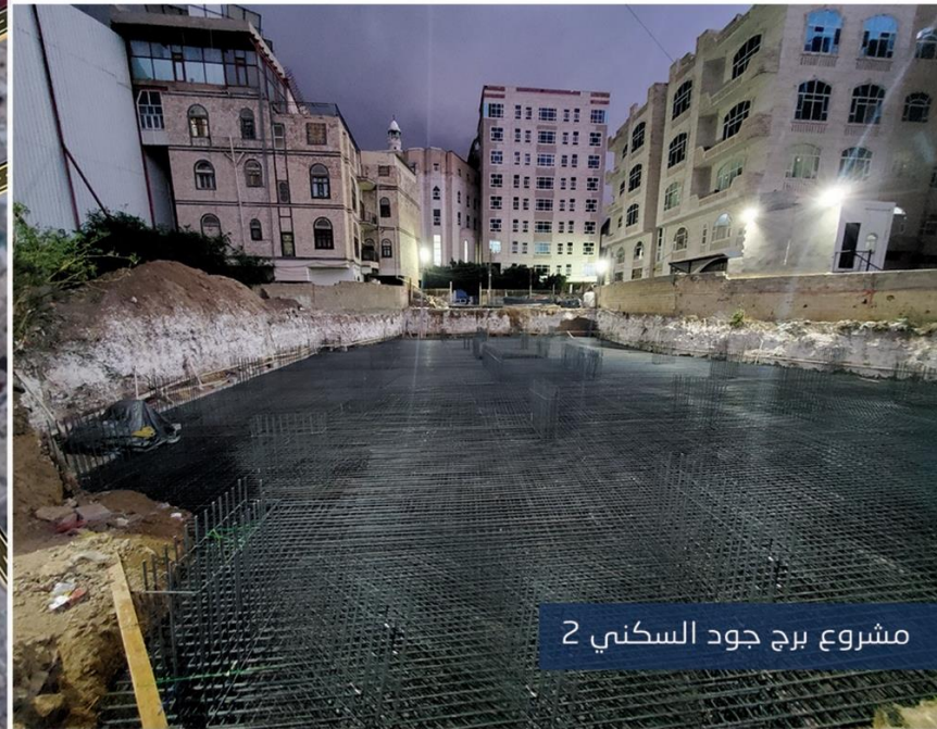
مشروع برج جود السكني 2