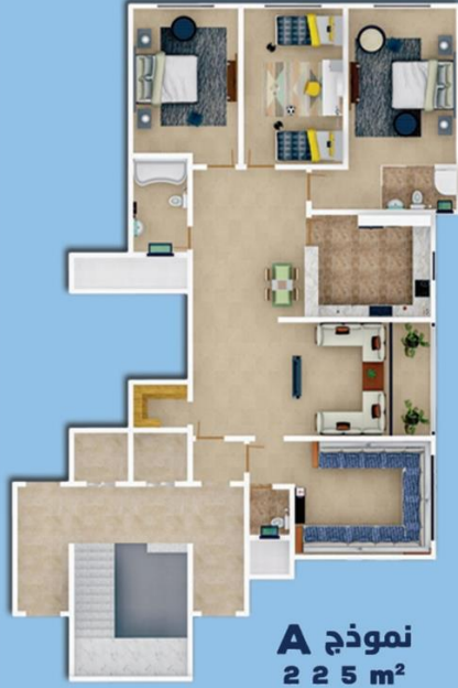
نموذج A 225 m²